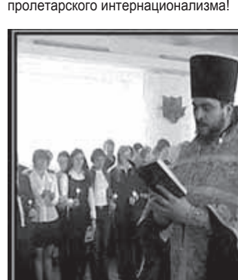
ЗА 5 ЛЕТ ЗАКРЫТО 12 377 ШКОЛ и открыто 20000 новых храмов

Согласно этому договору, Абэ стремится утвердить пакет законопроект, которые позволят Японии использовать право на коллективную самооборону, т.е. принимать участие в боях в действующих за границы вместе с войсками США. Он намерен утвердить эти военные законы под названием «законодательство мирной безопасности» на нынешней сессии парламента, что является обманом. Это не что иное, как нарушение действующей конституции Японии, в которой записан отказ от войны. Но правительство Абэ, не прислушавшись к голосам протест-